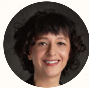
法國 伊曼紐·夏彭提耶