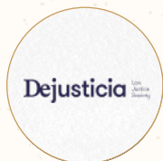
哥倫比亞 實現正義： 法律正義暨社會中心