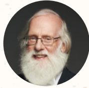
英國/美國 東尼·杭特