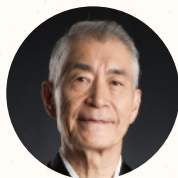
日本 本庶 佑