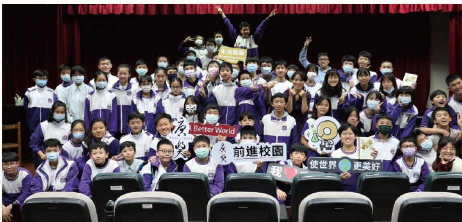
校園推廣 Campus Talks