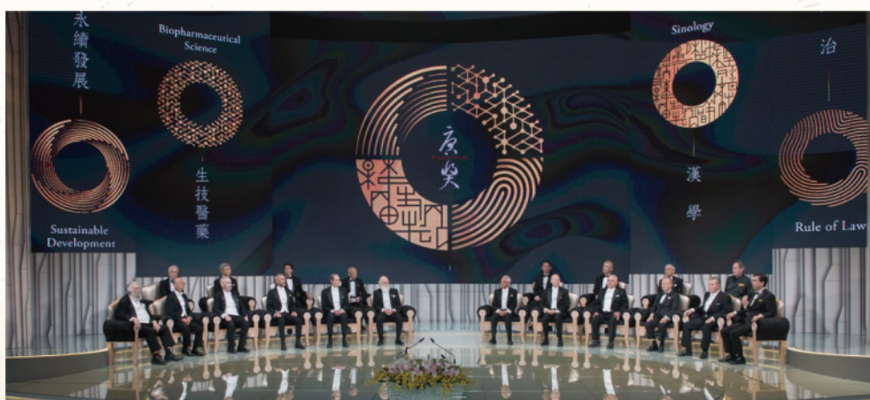
頒獎典禮 Award Ceremony