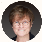
匈牙利/美國 卡塔林·卡里科