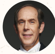
美國 布萊恩·德魯克爾