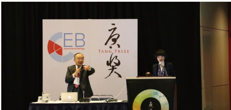
國際交流 International Connections