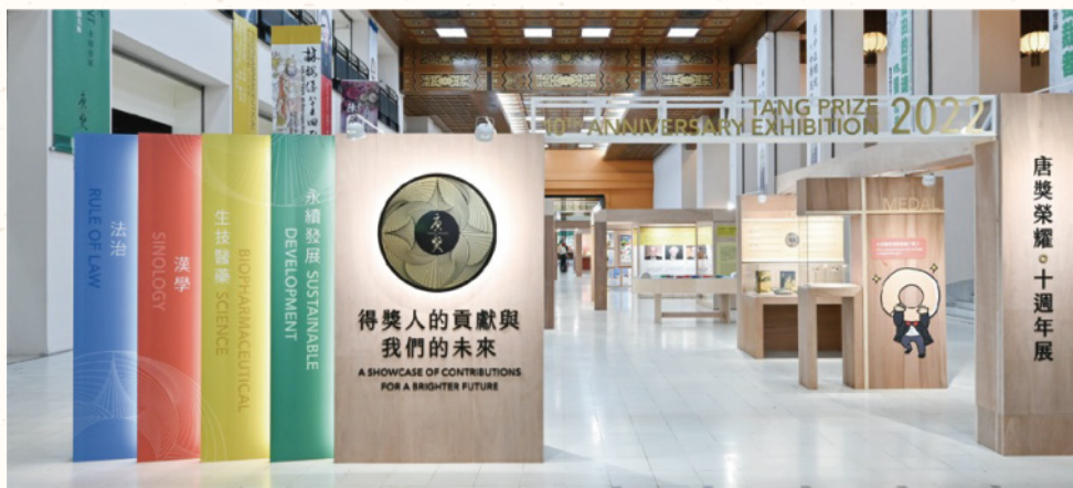
唐獎榮耀十週年展 Tang Prize 10th Anniversary Exhibition