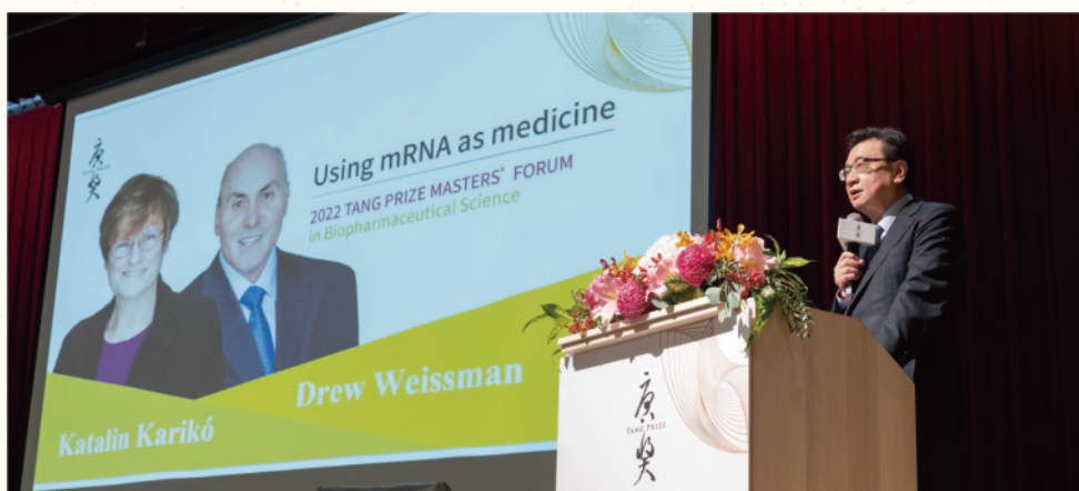
大師論壇 Masters' Forums