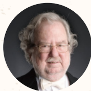
美國 詹姆斯·艾利森